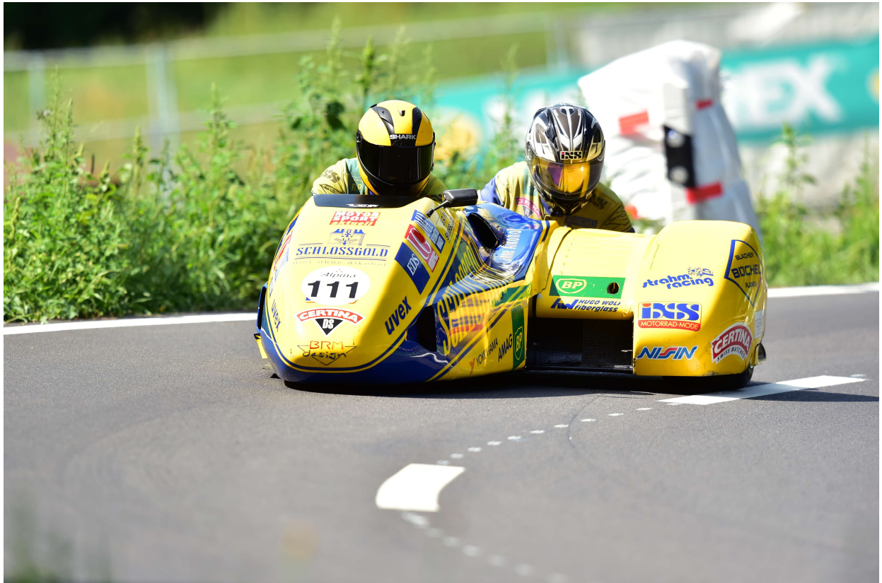
Rolf Biland & Kurt Waltisperg, 2017