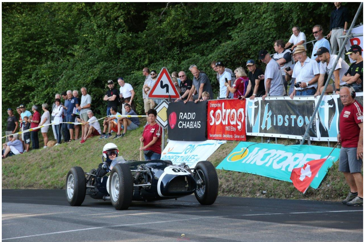
Ferguson P99, ex. Jo Bonnier record 1963