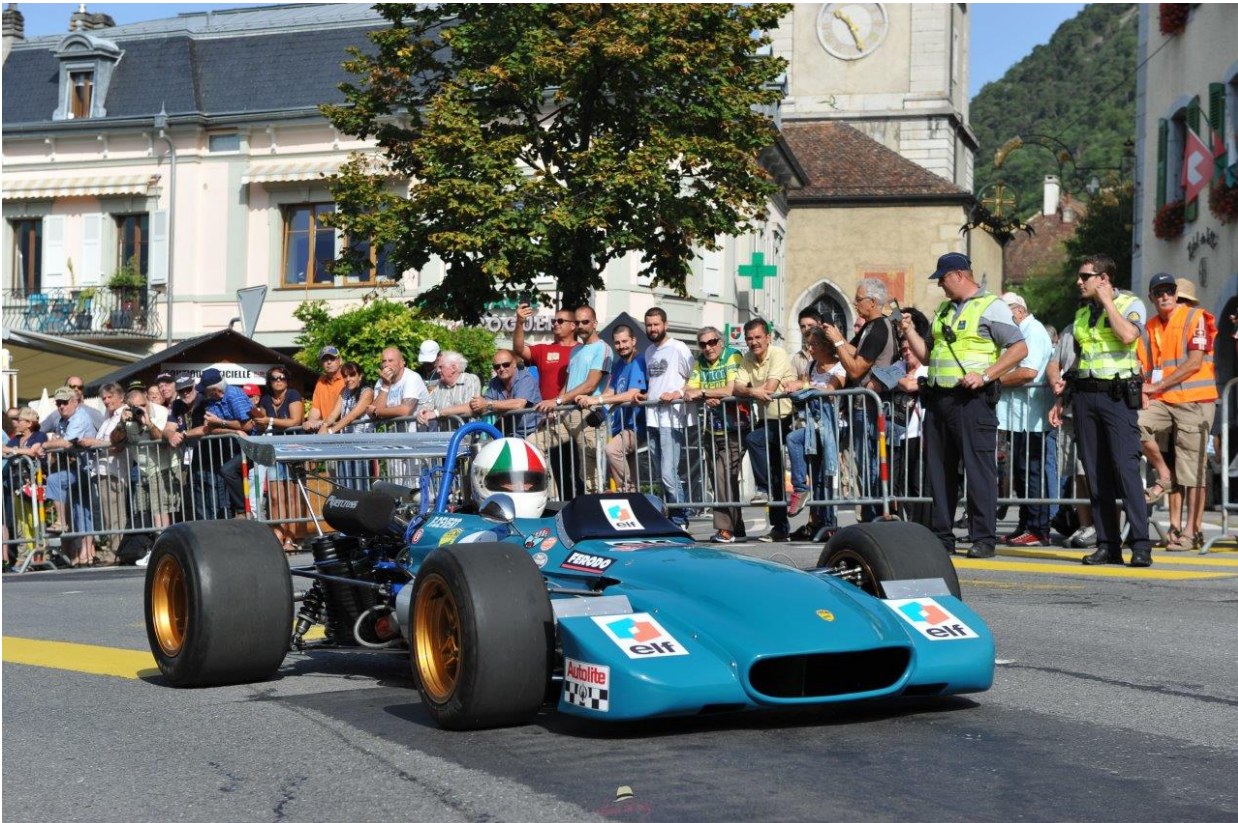
Tecno F2 Ex. François Cevert, record 1971