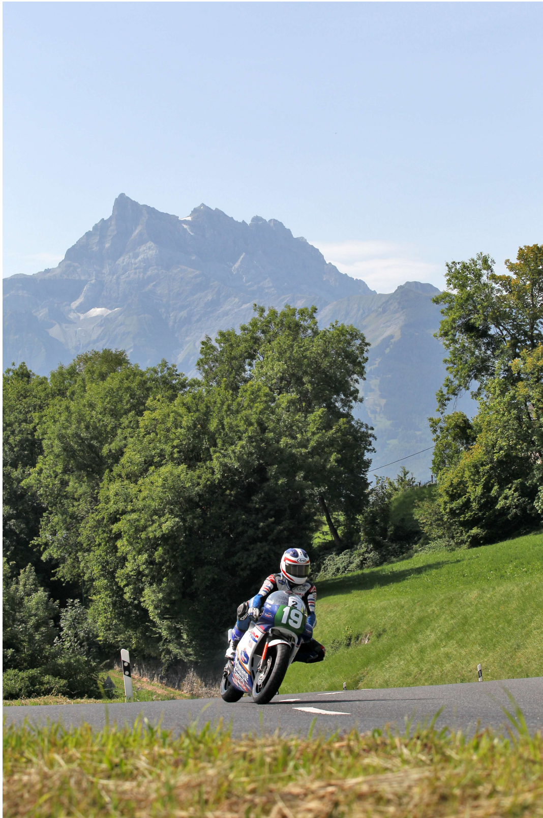
Freddie Spencer 2017, Honda