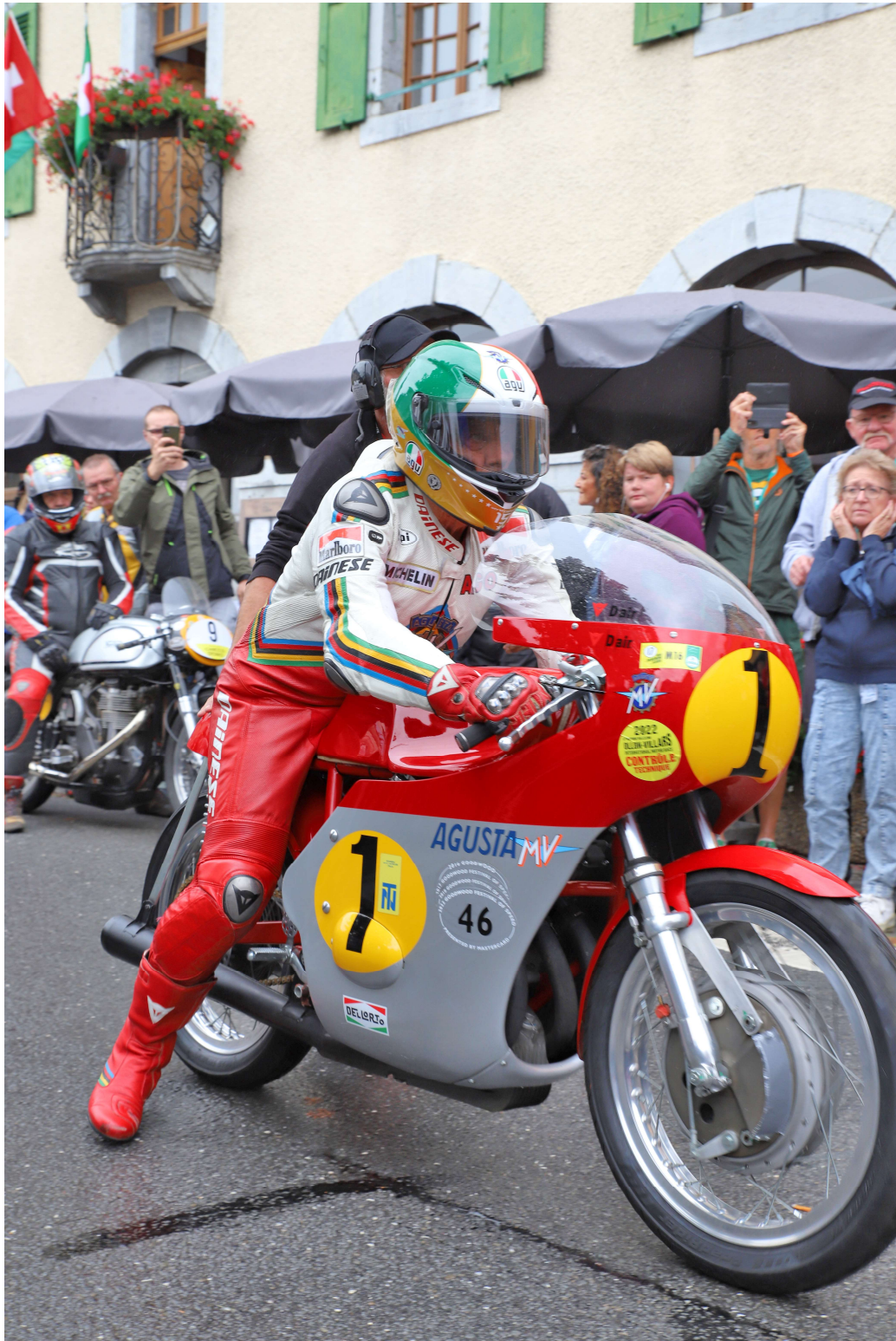
Giacomo Agostini 2022, MV Augusta