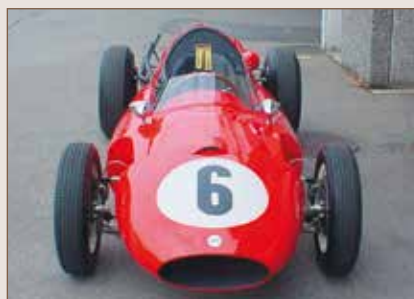
90 Cooper T45 Formule 1 2022 cc 1958 Lutziger Konrad Suisse