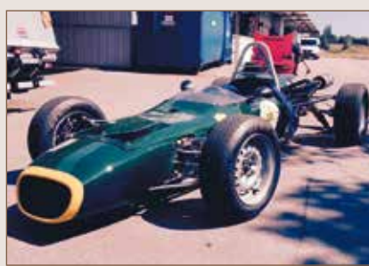
91 Lotus 35 997 cc 1965 Schaffner Bruno Suisse