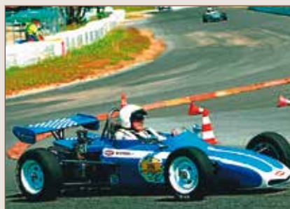
89 Citroen MEP X 27 1015 cc 1970 Fahrni Ernst Suisse