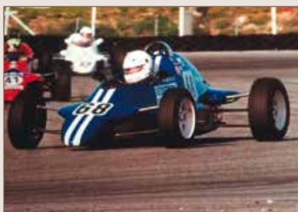
81 Rondeau M5 84 FF 1600 cc 1984 Renaud Joël Suisse