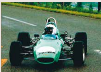
84 Chevron F3 B17 998 cc 1970 Brünigger Alfred Suisse